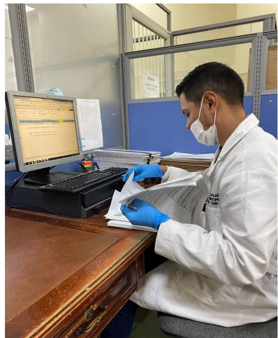
VERIFICACION DE FOLIOS