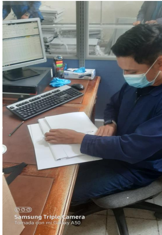
CAMBIO DE CARPETAS