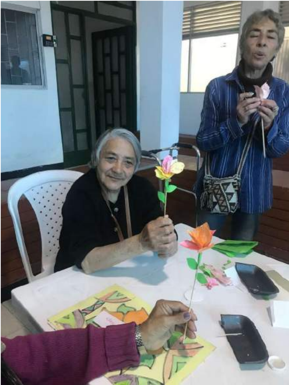
AGOSTO 16 DE 2024- TALLER DE TRAZOS TERAPEUTICOS