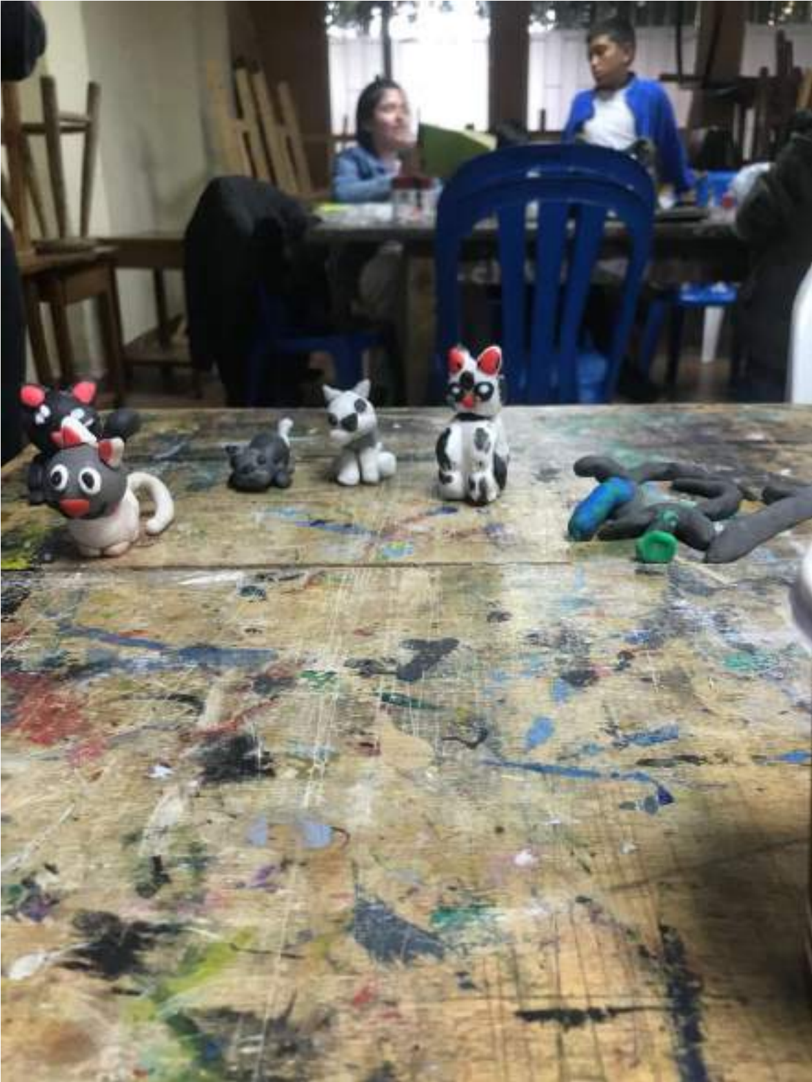
AGOSTO 12 DE 2024- INICIACION PLASTICA 3