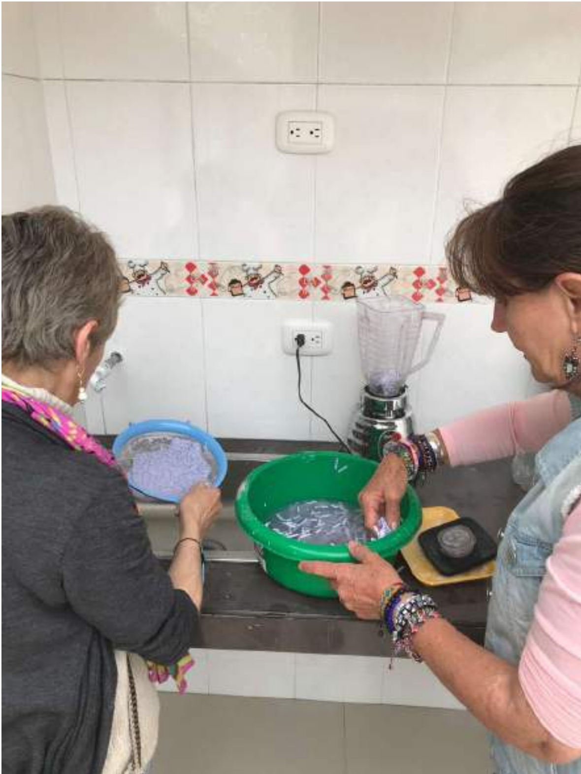
AGOSTO 13 DE 2024- ELABORACION DE PAPEL MACHÉ