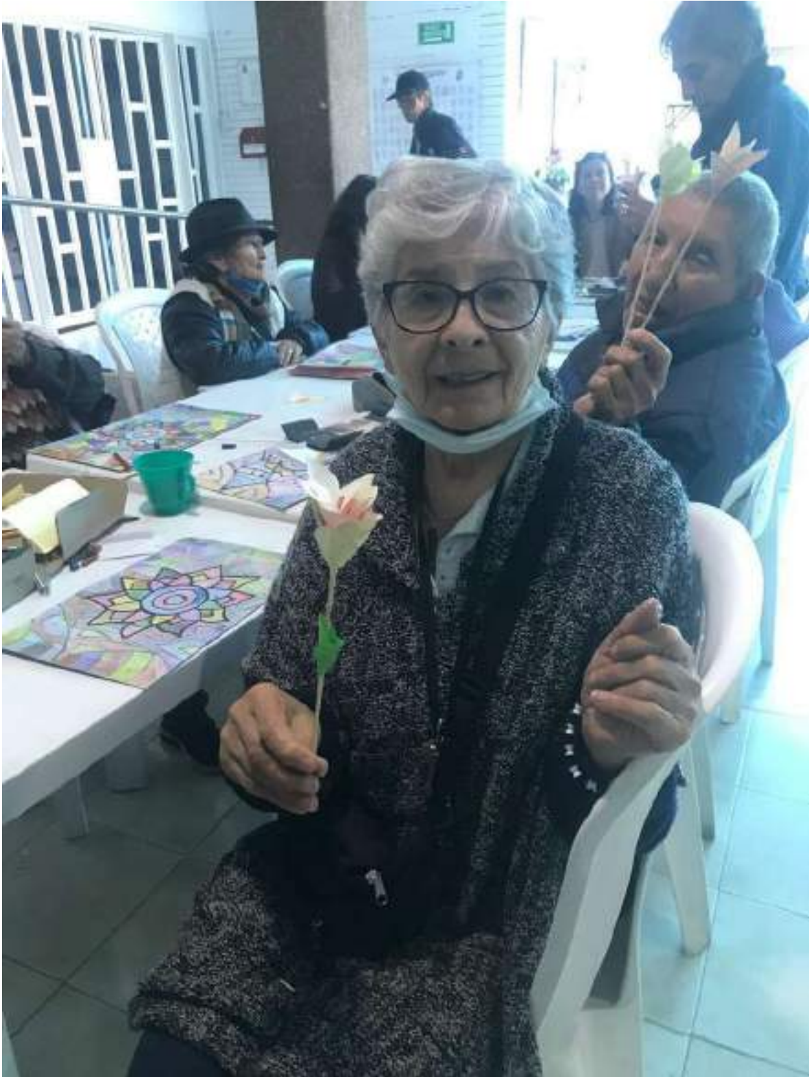
AGOSTO 16 DE 2024- TALLER DE TRAZOS TERAPEUTICOS