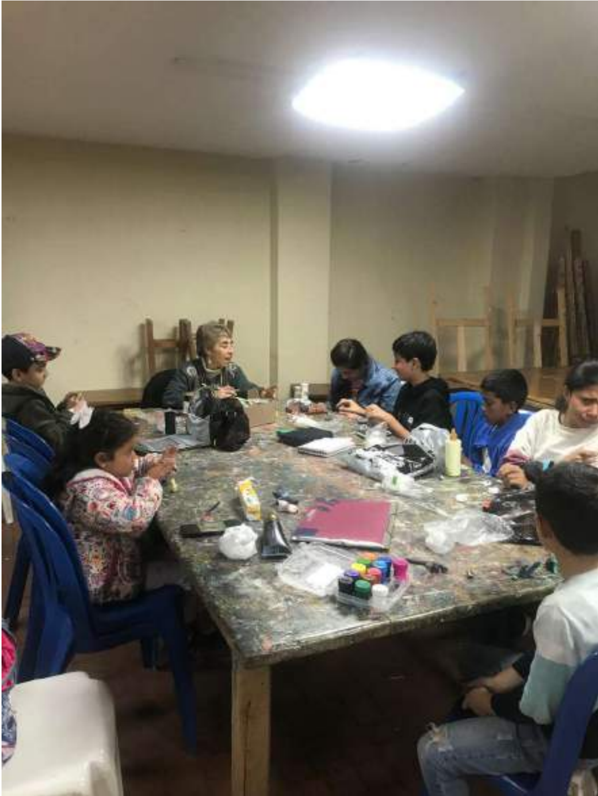
AGOSTO 5 DE 2024- INICIACION PLASTICA 3 –TRABAJO CON PORCELANICROM