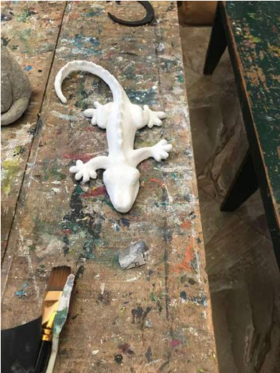
LAGARTIJA EN TALLER DE PAPEL MACHÉ – JULIO 30 DE 2024