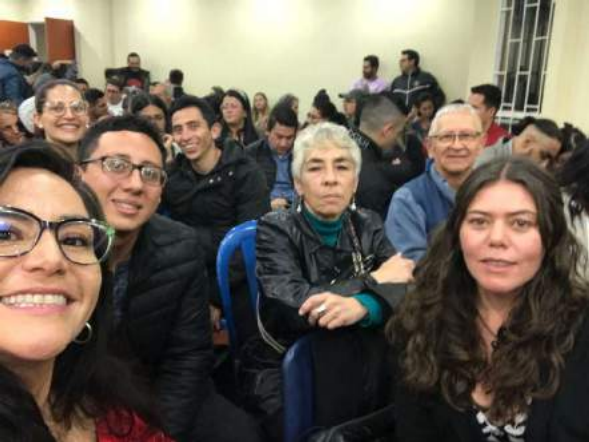
REUNIÓN GENERAL CON EL SEÑOR ALCALDE – AGOSTO 6 DE 2024