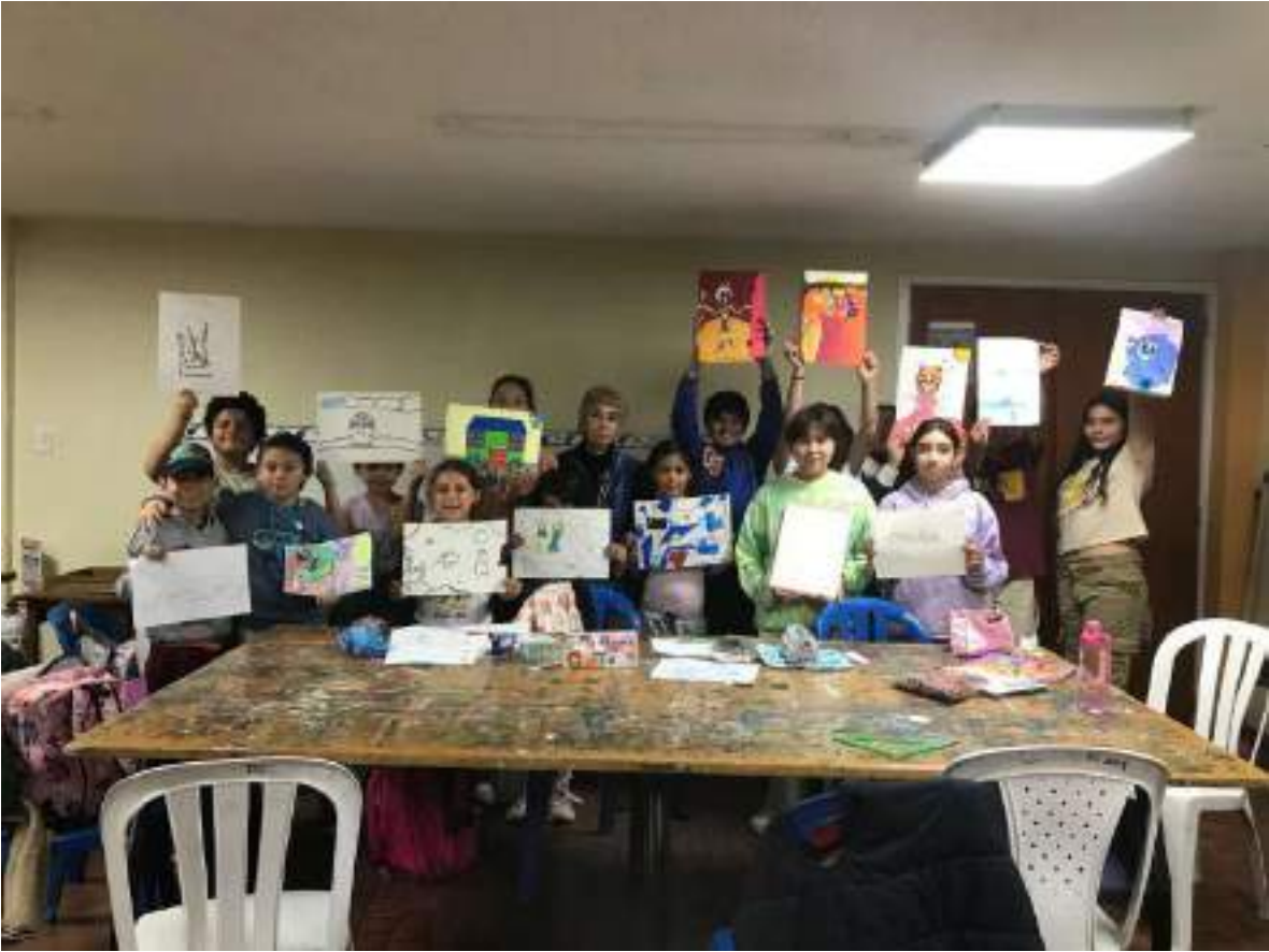
AGOSTO 24 DE 2024- INICIACION PLASTICA 2