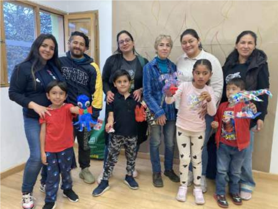
AGOSTO 27 DE 2024- TALLER DE ENSAMBLE ESCULTORICO