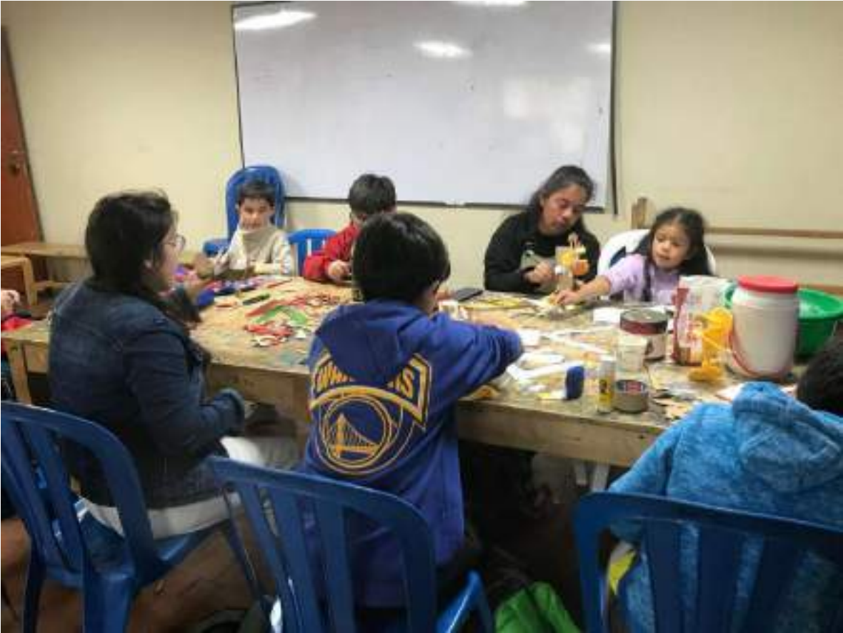
AGOSTO 26 DE 2024- INICIACION PLASTICA 3