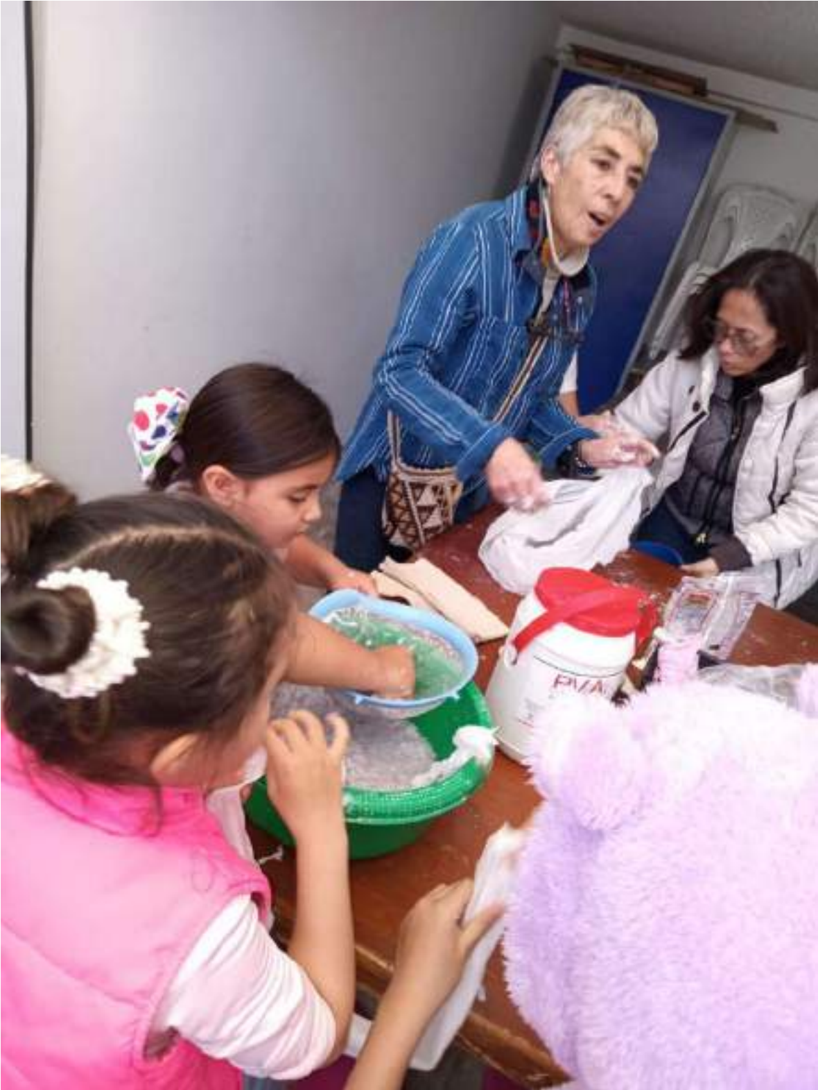
ELABORACION DE PAPEL MACHÉ GRUPO DE TITERES- AGOSTO 6 DE 2024