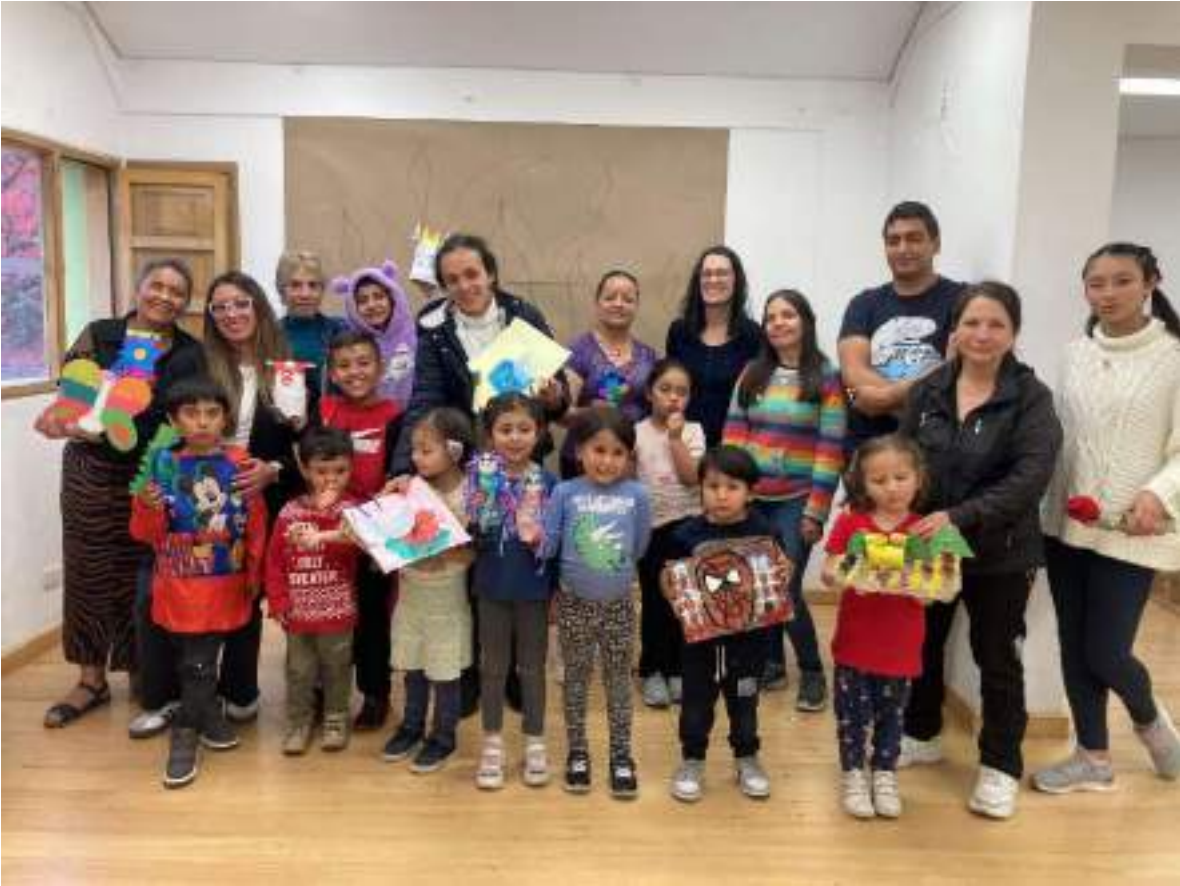
AGOSTO 27 DE 2024- TALLER DE ENSAMBLE ESCULTORICO