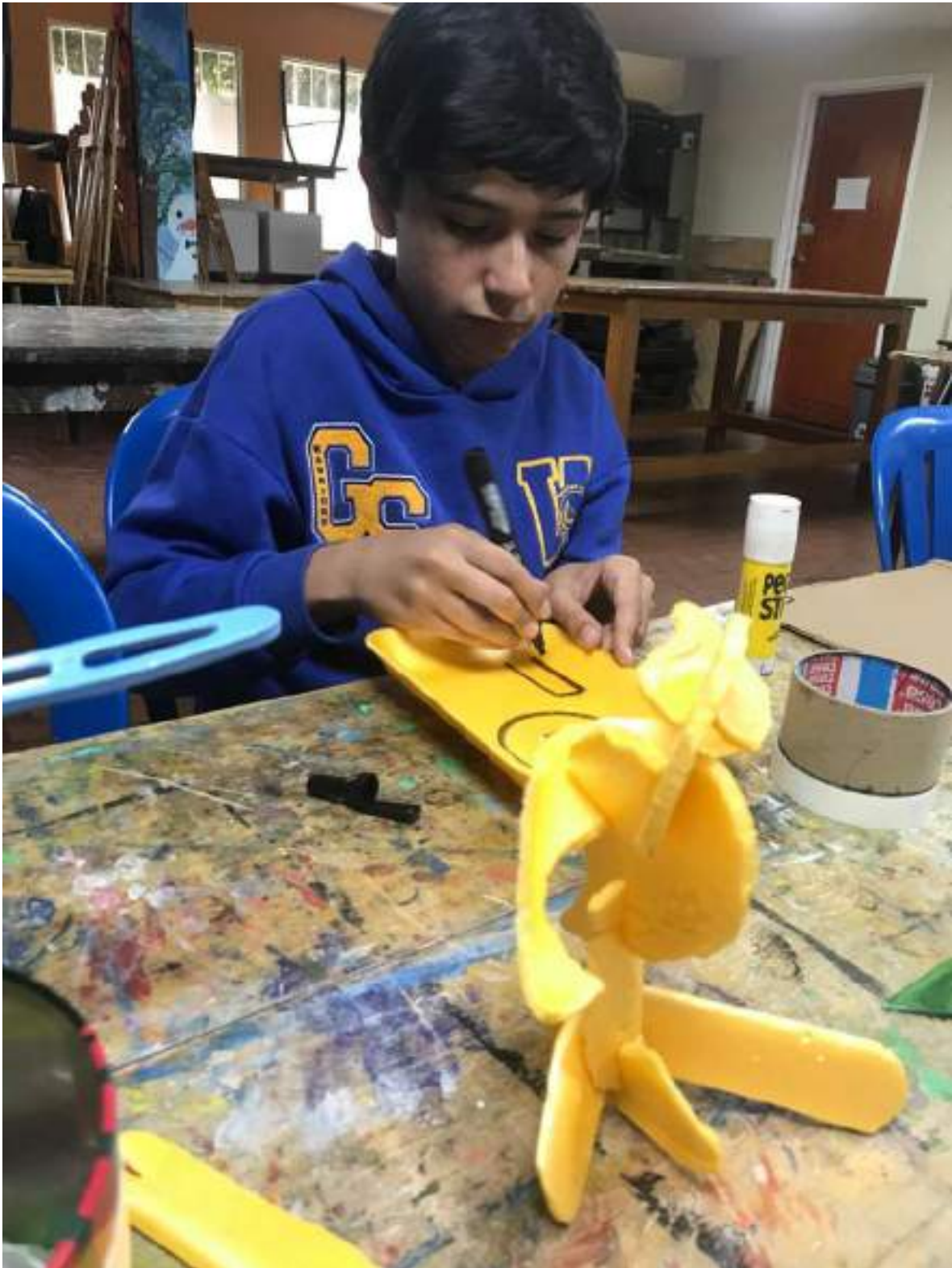
AGOSTO 26 DE 2024- INICIACION PLASTICA 3