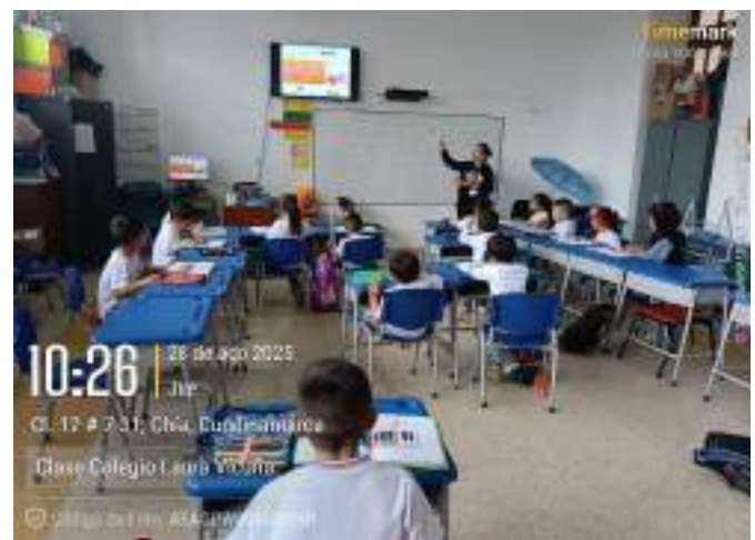
Clase Colegio Laura Vicuña, 28 de agosto.