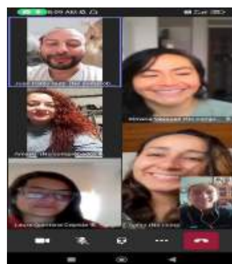
Reunión de área, 08 de agosto