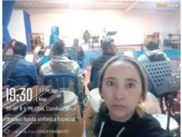
Ensayo Banda Sinfónica Especial 12 de agosto.