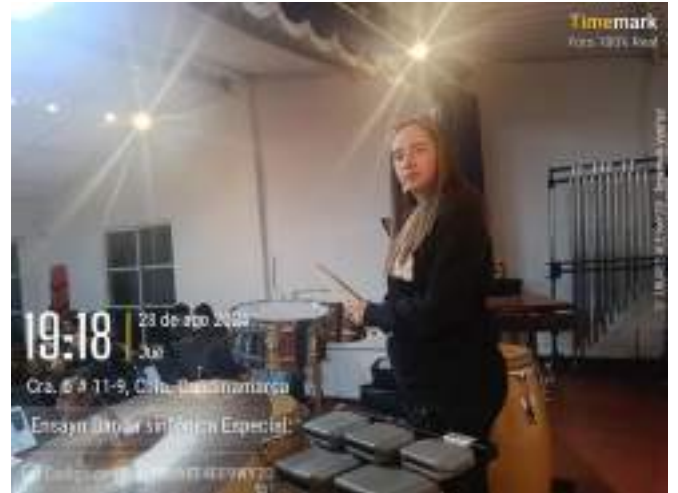
Ensayo Banda sinfónica especial, 28 de agosto.