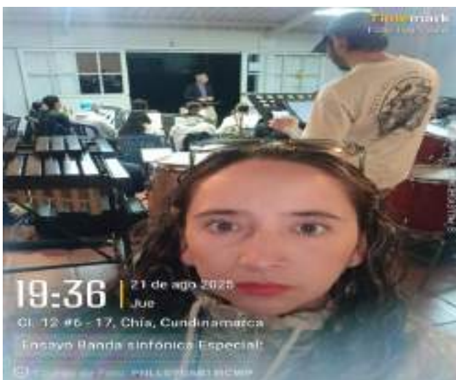
Ensayo Banda Sinfónica especial, 21 de agosto.