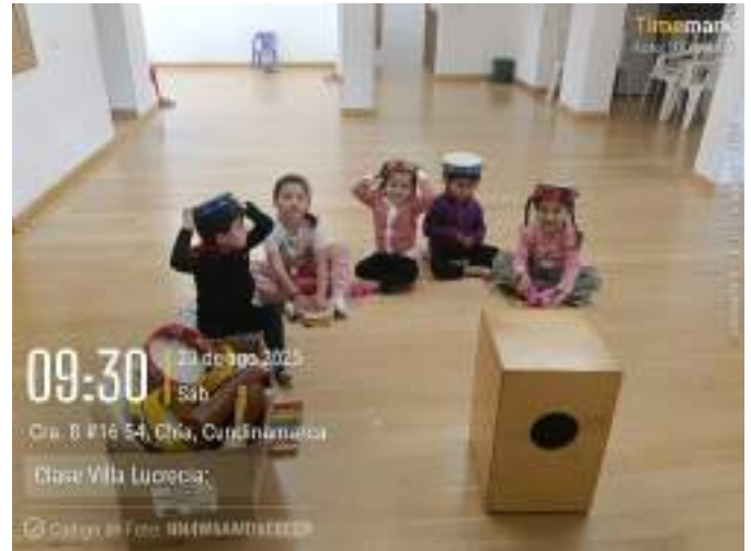
Clase Villa Lucrecia, 23 de agosto.