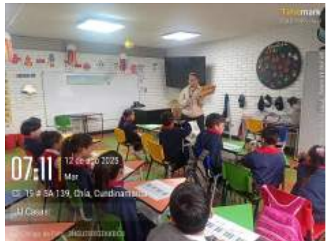
Clase JJ Casas, 12 de agosto.