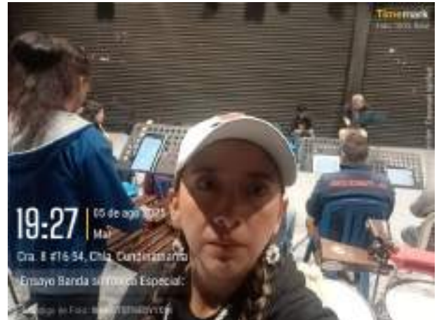
Ensayo Banda Sinfónica especial, 05 de agosto.