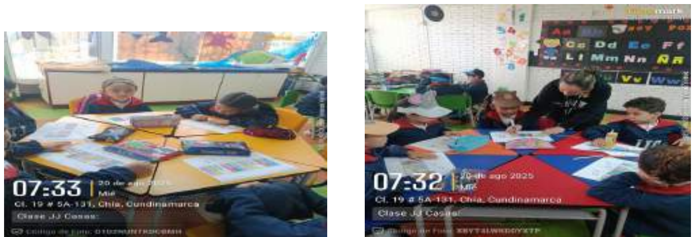
Clase JJ Casas, 20 de agosto.