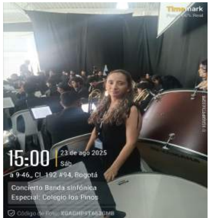
Concierto Banda Sinfónica especial 23 de agosto.