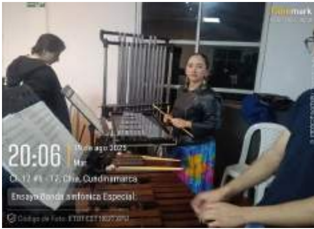
Ensayo de Banda Sinfónica especial, 19 de agosto.