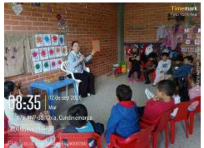
Clase CDI Nuevo milenio, 02 de septiembre.