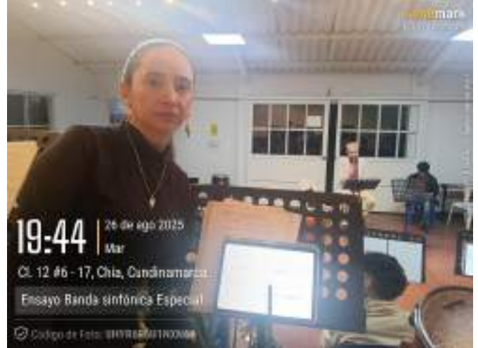
Ensayo Banda sífónica especial, 26 de agosto.