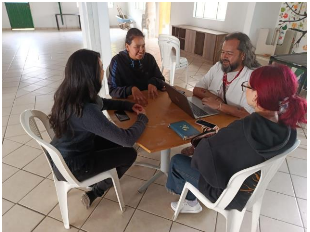
Registro Fotográfico Cuarto Encuentro