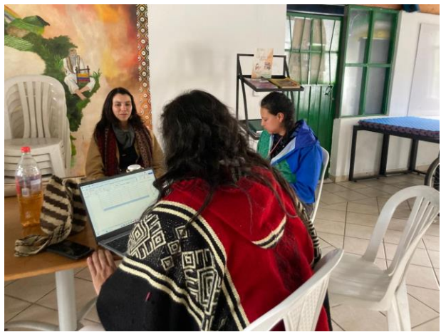
Registro Fotográfico Tercer Encuentro